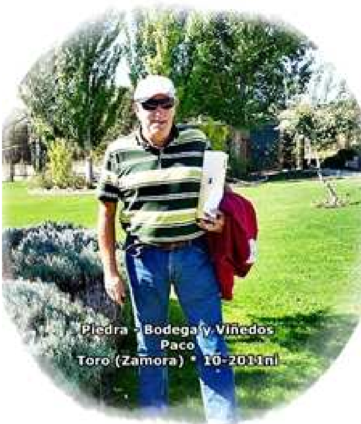
Piedra - Bodega y Viñedos Paco Toro (Zamora) • 10-2011ni