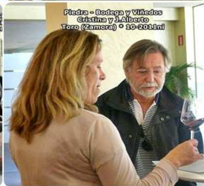
PIEDRA – BODEGA y VIÑEDOS TORO (Zamora)