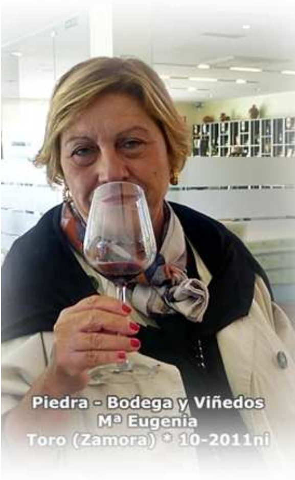
Piedra - Bodega y Viñedos M a Eugenia Toro (Zamora) * 10-2011ni