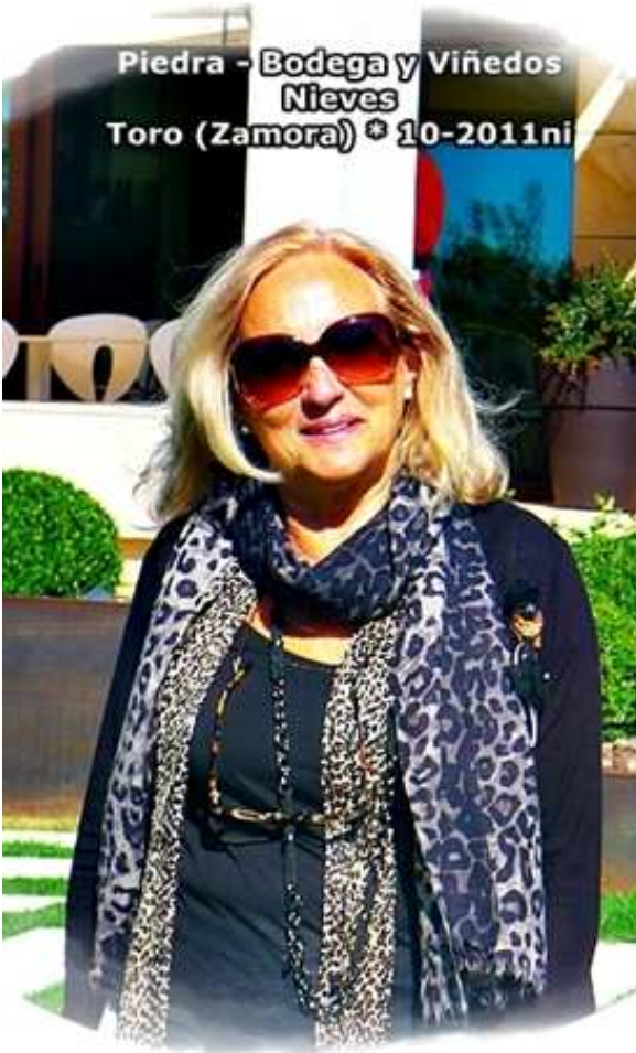
Piedra - Bodega y Viñedos Nieves Toro (Zamora) * 10-2011ni